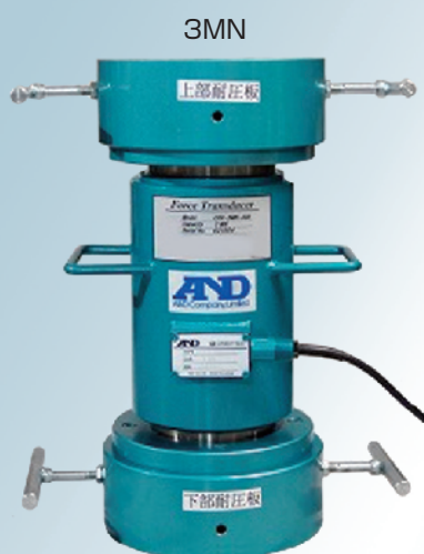
品質保証機関に納入