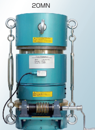
国家標準機関に納入