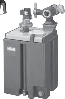
攪拌機、薬注定量ポンプを セットしたシステムタンク