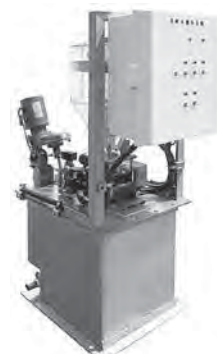
高分子凝集剤自動溶解ユニット EKPシリーズ