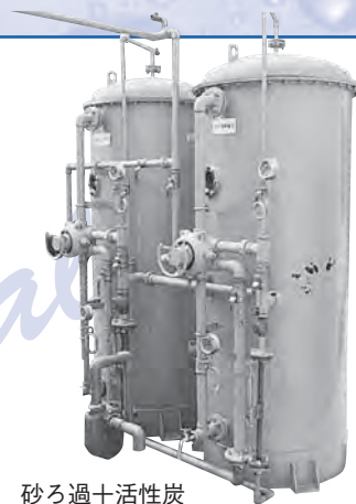
砂ろ過十活性炭 吸着ユニット