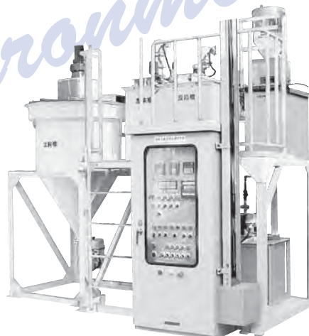
凝集沈殿処理ユニット PDシリーズ