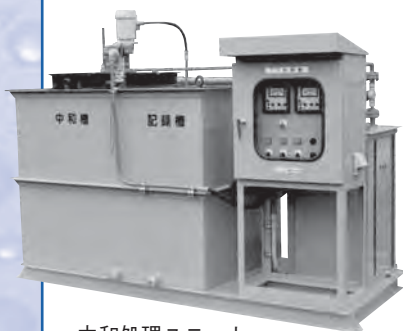
中和処理ユニット PBシリーズ

エレポン化工機の水処理技術は40年以上の経験を生かし、専門の技術スタッフがその生産プロセスの構成や廃棄物による影響を深く理解し、排水性状を正確に把握して、環境設備をいかに有効活用するか幅広くご提案させていただきます。