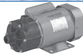
マグネットドライブ シールレスポンプ SLシリーズ