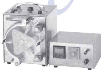
小型チューブポンプ TR-PU、TR-CU