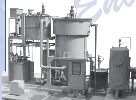
加圧浮上ユニット PALシリーズ