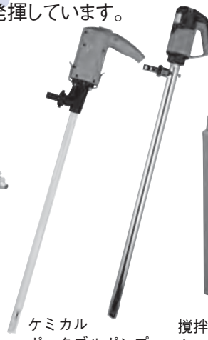
ケミカル ポータブルポンプ