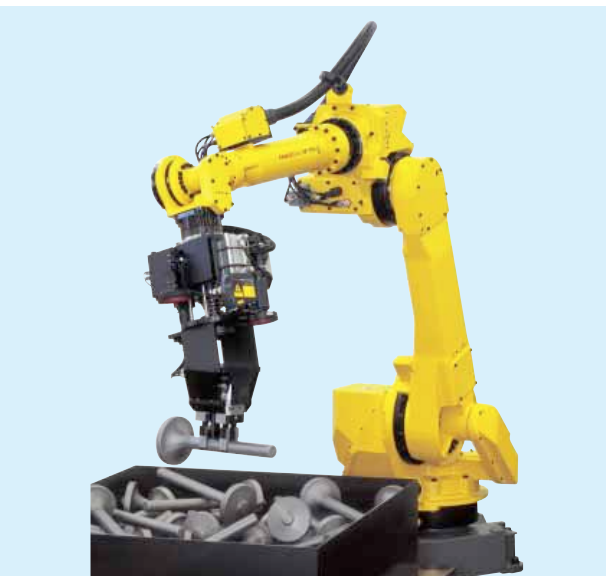
M-710iC/50による円柱部品バラ積み取出し