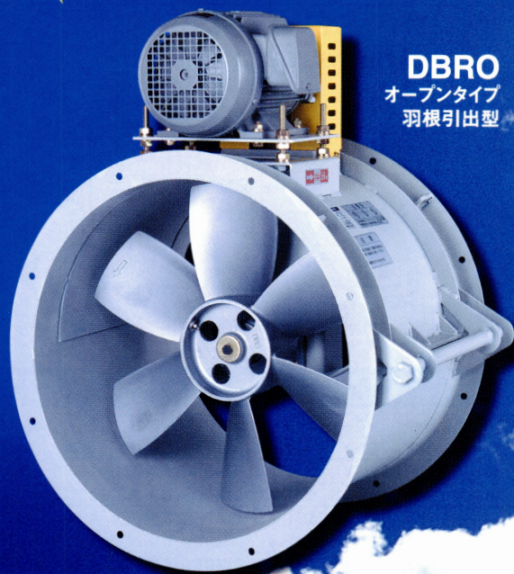
DBRO オープンタイプ 羽根引出型