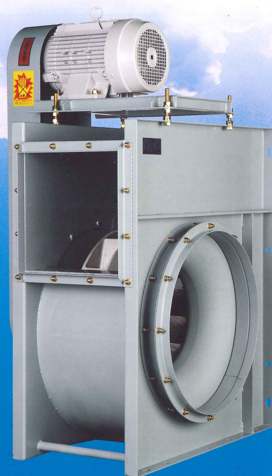
TF型ベルト駆動ターボ

TF20 TFF20 TF25 TFF25 TF30 TFF30 TF35 TFF35 TF40 TFF40 TF45 TFF45 TF50 TFF50 TF55