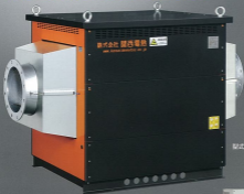
型式 12B54 定格温度: 250℃