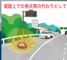
道路上での発炎筒の代わりとして