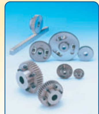
アンチバックラッシギヤ