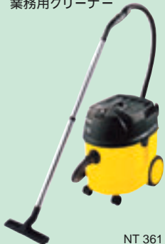
NT 361 Eco