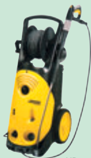
HD 10/22 S