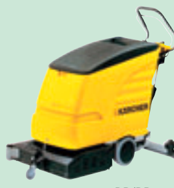
BR/BD 530 BAT