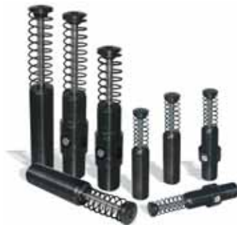
【エニダイン(株)】 http://www.enidine.co.jp/ 資料請求番号：22-147

当社製品のモデルチェンジした産業用ショックアブソーバです。当社従来品に対し、吸収エネルギー容量が60%UPし、ストッパーとしても使用が可能です。更に、従来の調整ダイヤルの突起をなくし、設置時の緩衝を解消しました。自動車業界も含め一般産業界において最も広く採用されている弊社ショックアブソーバの後継機種になります。調整型の OEMXT1.5・2.0 シリーズと固定型の PMXT 1500/2000 シリーズがあります。