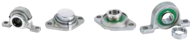
【旭精工(株)】 http://www.asahiseiko.co.jp/ 資料請求番号：22-146

玉軸受ユニット・エコシリーズは軸受箱にステンレス 鋳鋼 SCS13、軸受には SUS440C 相当品、偏心輪には SUS304 を使用したオールステンレス製軸受ユニットで、耐食性に優れています。食品機械用グリースを封入した形式もあり、食品機械等でも安心して使用することができます。特長は①優れた耐食性と強度。②軸受箱にロストワックス精密鋳造品を採用し、特殊な表面処理を行うことで美しい外観を呈しています。③コンパクトで設備設計の小型化が図れます。RoHS 指令にも適合しています。④偏心方式で、軸への固定が容易です。この方式により、止めねじ固定による内輪の応力腐食割れを軽減しています。