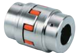
【ケーティアーナルジャパン(株)】 http://www.ktr.com/ 資料請求番号：22-149

ROTEX は KTR 社が世界で初めて開発したジョータイプのフレキシブルカップリングで世界で最も使用されています。国産類似品の同サイズに比べトルク伝達力は 4～7 倍であり、ハブとスパイダーのかみ合い形状からスパイダー寿命が長く交換手間が省けます。サイズ、種類が豊富で軸穴径 \phi 6 \sim \phi 200 に対応可能であり、多くのアプリケーションに採用されています。適応例は、各種ポンプ、減速装置、昇降装置、船用機器、印刷、製紙、製鉄、射出成形農林業、食品、搬送装置等で実績も豊富です。ケーティアーナル社はカップリングの専門メーカーとしては世界トップクラスのドイツのメーカーです。