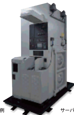
半導体製造装置施工例

最大3000kgf/m 2 までの重荷重に対応でき、サーバーや精密機器、美術品など大切な資産を地震から守ります。またサーバールームやオペレーションセンターなどフロア全体の免震も可能です。