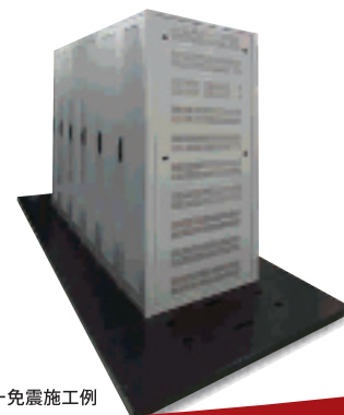
サーバー免震施工例