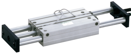
プレート固定式(Yタイプ)