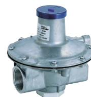
調整スプリング種別