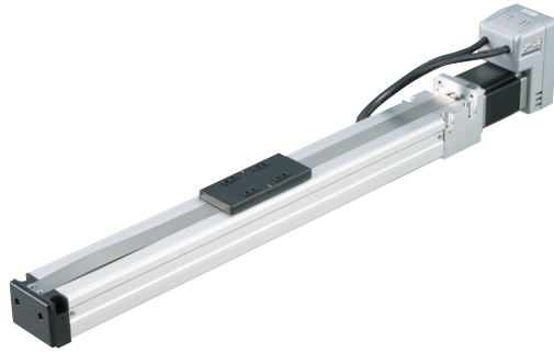
モータ、エンコーダ、ドライバ、コントローラ、PLC、電源をすべて内蔵