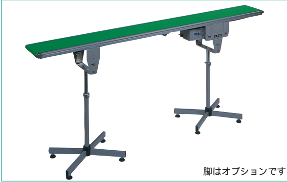
脚はオプションです