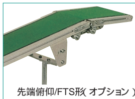
先端俯仰/FTS形(オプション)