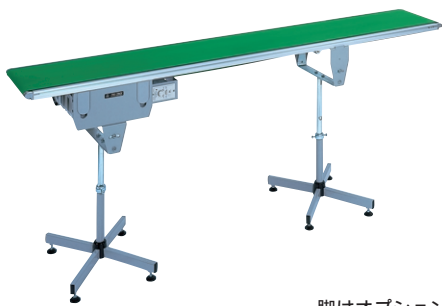
脚はオプションです。