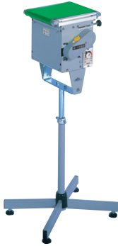
脚はオプションです。