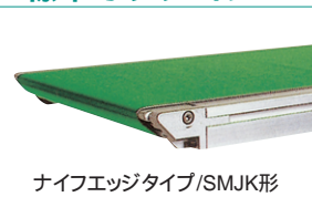
ナイフエッジタイプ/SMJK形