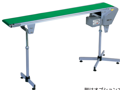
脚はオプションです。