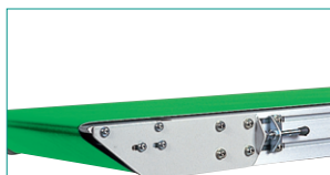
ナイフエッジタイプ/SMH形