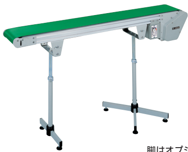
脚はオプションです。