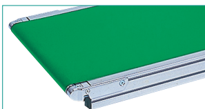
小径ローラタイプ/SMHM形