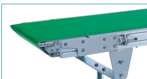
ローラエッジタイプ/SMHB形