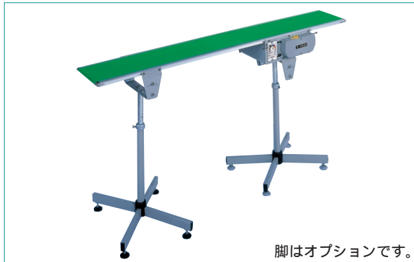
脚はオプションです。