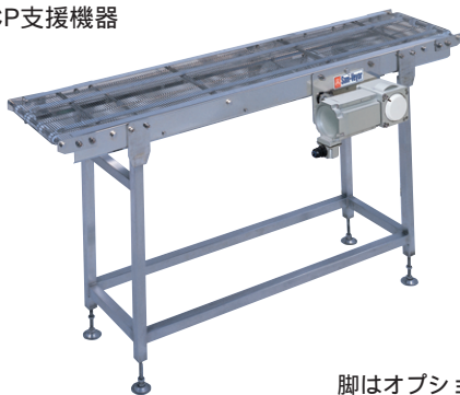
脚はオプションです。