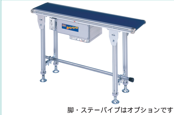
脚・ステーパイプはオプションです