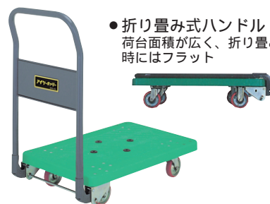
●折り畳み式ハンドル 荷台面積が広く、折り畳み時にはフラット