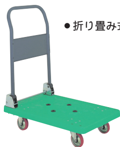
●折り畳み式ハンドル