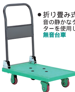
●折り畳み式ハンドル 音の静かなタイプのキャスターを使用しています。 無音台車