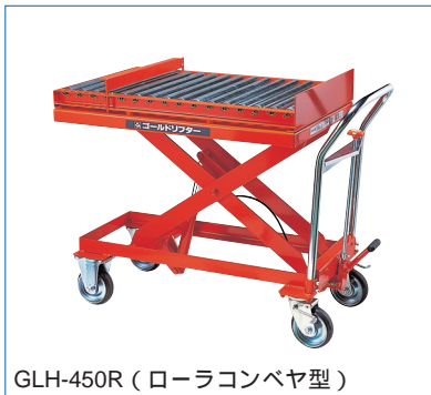
GLH-450R (ローラコンベヤ型)