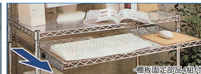
・棚板固定部品4組付