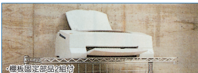
・棚板固定部品2組付