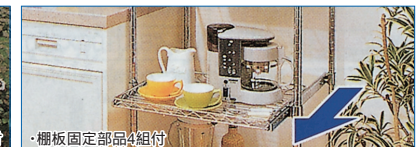
・棚板固定部品4組付